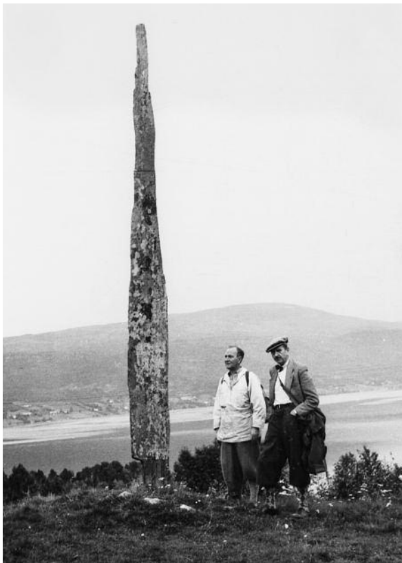
Trollpila på Bolsøya. I gammel tid trudde dei at denne steinen var ei pil trollet i Skåla skaut første gongen det høyrde kyrkjeklokkene på Bolsøya.

som trollet hadde i Breiskaret mellom Skåla og Horga. Men den farlege oksen til trollet med store horn jaga dvergen heim att og inn i berget der ytst på neset.