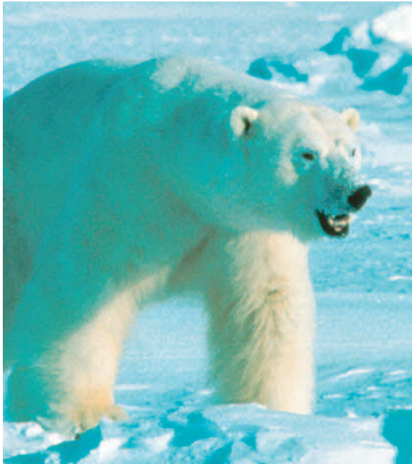
På fjellgarden Barsteinen jaga ein kvitbjørn trolla på dør julekvelden.

på garden sa at dit kom det så mykje troll den natta at dei sjølve måtte flytte ut i ut-husa. Men mannen og bjørnen meinte at dei nok skulle greie seg.