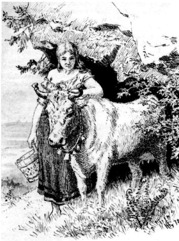
Huldra hadde fine kyr. Dei var blå og hadde fine knoppar på horna. (Teikning av Theodor Kittelsen.)

På setrene var ikkje folket (budeia og gjetaren) åleine. Huldra var der – om ein ikkje såg ho så ofte. Ho heldt mest til i ein haug eller ein stor stein, trudde dei. Desse kunne ha namn som Hulderhaugen eller Huldersteinen. Dei kunne òg meine at huldra budde under seterhusa. Difor måtte dei passe på å ikkje slå ut vatn som var heitt. Hulderfolket kunne få det utover seg og brenne seg forderva.