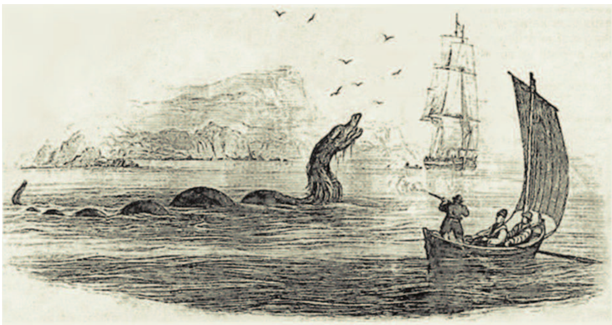
For meir enn 250 år sia skaut ein mann med borse på ein stor sjøorm i Julsundet. Biskop Erik Pontoppidan fekk laga denne teikninga.

stader stod det ein tom bås i fjøsen for han. Han har også vore kalla fjøsnisse. Men etter som tida gjekk, var det mange som helst ville jage han.