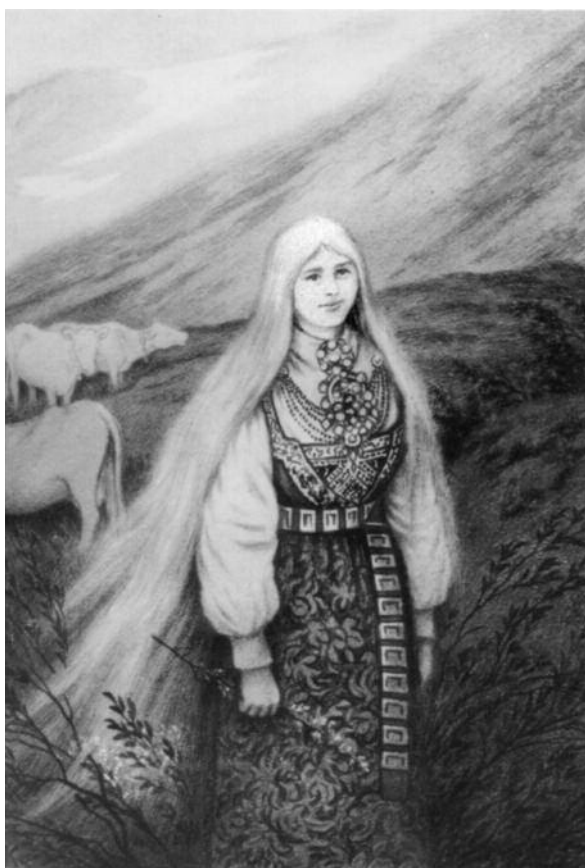
Det hende at folk som var til fjells møtte huldra. Iblant hende det at ein gut forelska seg i ei fager hulder og tok henne med til bygds. (Teikning av Theodor Kittelsen.)

Det hende at folk vart tekne inn i berget, dei vart det dei kalla bergtekne. Somme kom seg ut att. Dei kunne vere noko merkelege etter ei slik hending. Somme vart aldri slik som dei hadde vore før.