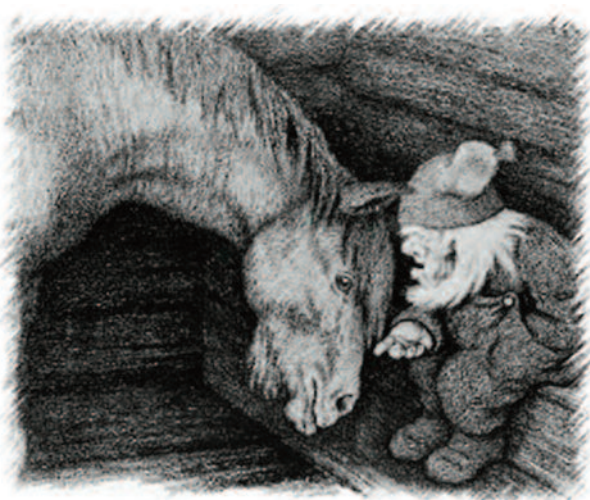
Tuftekallen passa på garden og såg til at alt vart gjort på gammal måte. (Teikning av Theodor Kittelsen.)

På somme gardar hadde han eiga seng inni husa. La nokon seg i denne senga, vart han oftast slengd fram på golvet. Andre